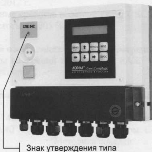
Сумматор СПЕ542. Общий вид